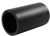
Tuleja SL PPS